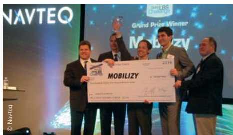
Preisregen in Barcelona: Mobilizy gewinnt bei der Navteq-Challenge