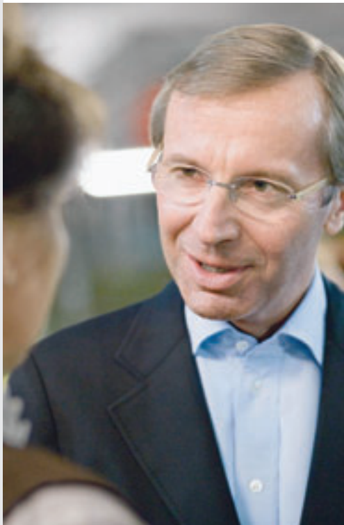
Landeshauptmann-Stellvertreter Dr. Wilfried Haslauer im Gespräch

techno_zine hat mit Landeshauptmann-Stellvertreter und Wirtschaftsreferent Dr. Wilfried Haslauer über die Erfolge und Verbesserungsmöglichkeiten der Salzburger Technologiepolitik sowie die Rolle des Techno_Z gesprochen.